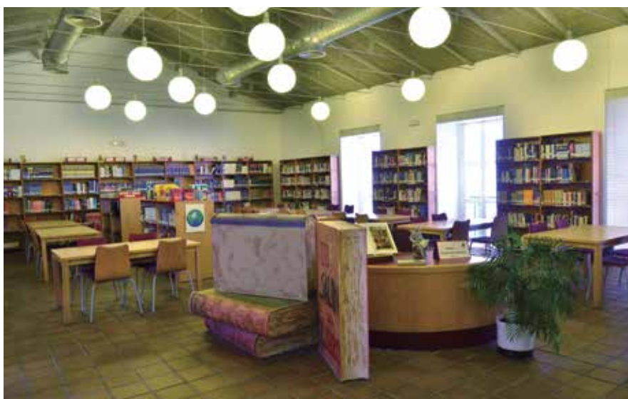
La Junta informó la propuesta de la Federación al Real Decreto que regula la remuneración a los autores por el préstamo de sus obras en bibliotecas.

Además de esta cuestión, la Junta dio su visto bueno a la firma de varios convenios y protocolos, entre ellos, el de colaboración con el Consejo Superior de Deportes para la realización de acciones conjuntas que faciliten la celebración de eventos deportivos en las Entidades Locales (más información en la página 23). ★