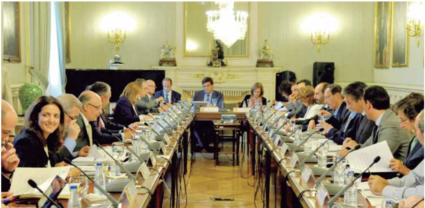
En la CNAL se dieron a conocer los objetivos de déficit para el próximo trienio.

El segundo factor lo resumió diciendo que un Ayuntamiento es un elemento vivo, dinámico y sometido a variables a lo largo de todo un año. Por ello sería preciso aportar una lista más amplia de excepciones para el cumplimiento del techo de gasto en la que contemplar "algunos casos que consideramos extraordinarios".