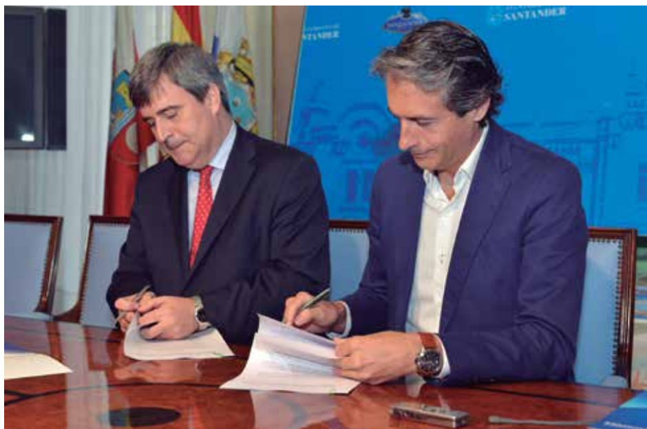
El Presidente del CSD, Miguel Cardenal, y el Presidente de la FEMP, Íñigo de la Serna, suscriben el acuerdo.

En el marco del acuerdo, que tiene una duración de un año, con posibilidad de prórroga hasta un límite de cuatro, las dos partes se comprometen a colaborar activamente para favorecer la celebración de eventos de interés y, además, a darles difusión a través de todos sus medios.★