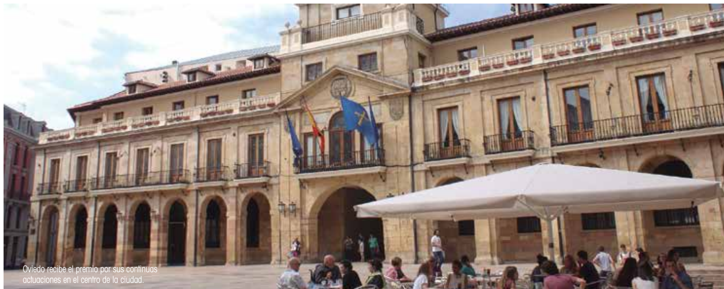
Oviedo recibe el premio por sus continuas actuaciones en el centro de la ciudad.