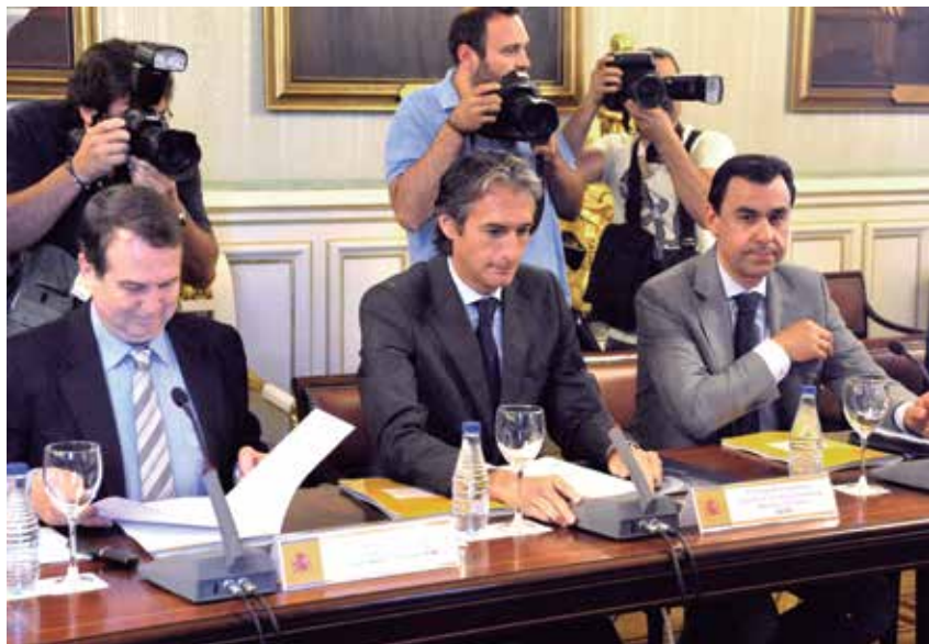
El Presidente y los dos Vicepresidentes de la FEMP, en los minutos previos a la Comisión.

En cuanto a los objetivos de deuda pública para la Administración Local, también en porcentaje sobre Producto Interior Bruto, se fijan en 9,9 para 2015; 3,8 para 2016; y 3,6 para 2017. Estos son aún más