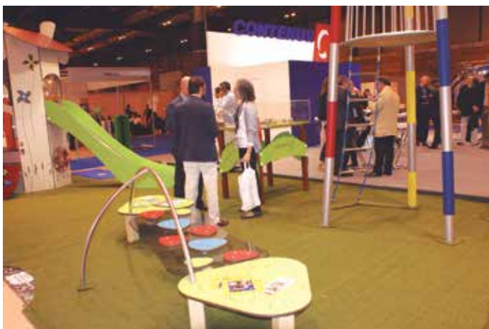
A TECMA acudieron cerca de medio millar de empresas de 17 países.

El Foro de las Ciudades, según los organizadores, pretende convertirse en el lugar donde las Entidades Locales y los ciudadanos ponen en valor las sinergias para construir una " ciudad con ciudadanía ", en la que el factor humano prime entre los requisitos necesarios para diseñar espacios urbanos habitables. También es una cita para las empresas y el mundo científico-académico, agentes potencias que proporcionan las claves para conocer hacia dónde caminan las ciudades para convertirse en lugares sostenibles y eficientes.