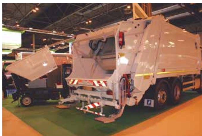
Camiones para la recogida de residuos en el espacio de la Feria.

También hubo una numerosa presencia de representantes municipales de países de América Latina, en concreto de países como México, Perú, Paraguay, Brasil, Honduras y Bolivia, entre otros. ★